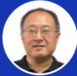
权衡 武汉纺织大学 教授/博导