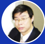
黄建滨 北京大学 教授/博导